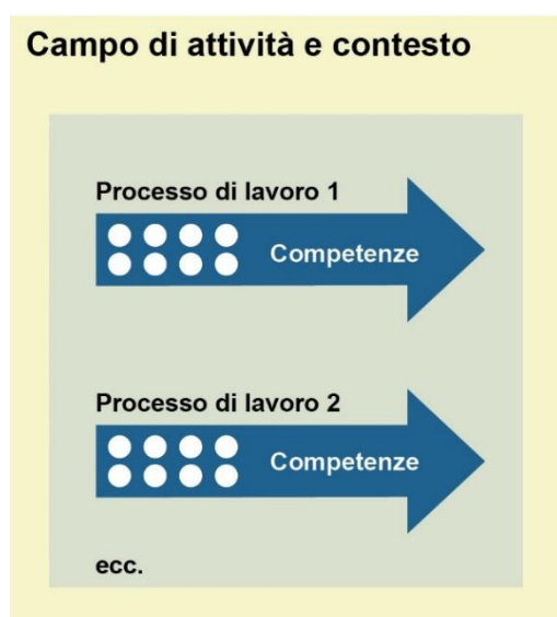
Figura 1: Struttura del profilo professionale

Il presente profilo professionale si basa sulla struttura rappresentata nella figura 1.